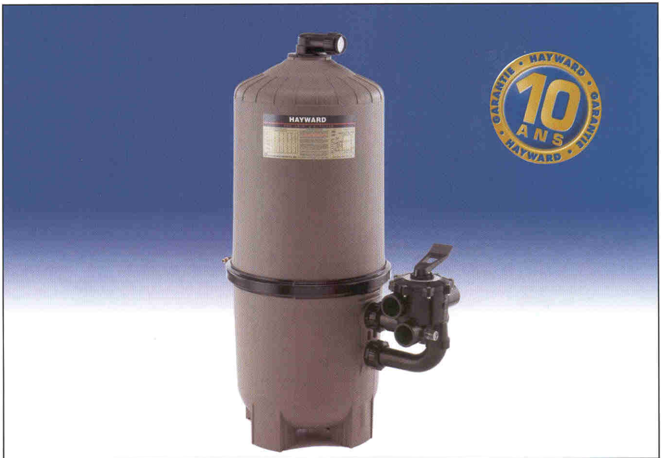
■ DE7220 : Filtre à diatomée Pro-Grid avec sa vanne 6 voies

FILTRES A DIATOMÉE / VERTICAL GRID D.E. FILTERS