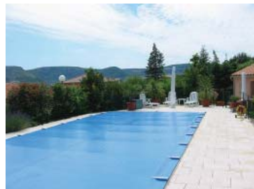
Couverture de sécurité SUPER SECURIT