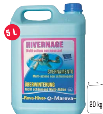
150 015 - 5 L