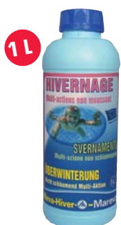
150 067 - 1 L

Utilisez les biocides avec précaution. Avant toute utilisation, lisez l'étiquette et les informations concernant le produit.