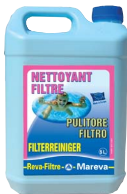
150 035 - 5 L

REVA FILTRE nettoie le filtre de ses matières grasses puis s'attaque au calcaire contenu dans son sable.