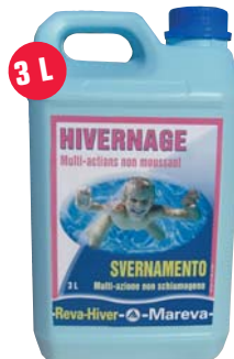
150 016 - 3 L