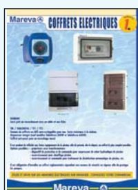
450 079 Tablorea