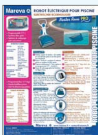
450 133 Nestor Reva Pro