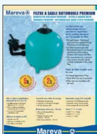
450 059 Filtre Premium