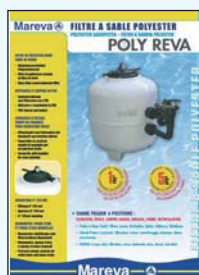
450 084 Poly Reva3