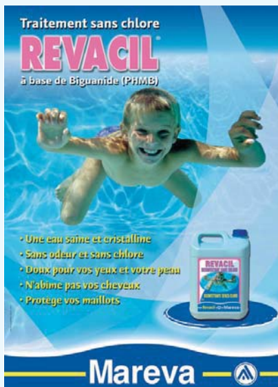
450 227 REVACIL