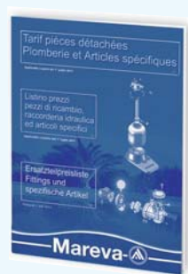
450 825 - Tarif Pièces Détachées