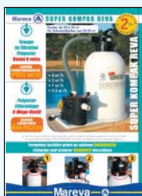
450 088 Super Kompak Reva