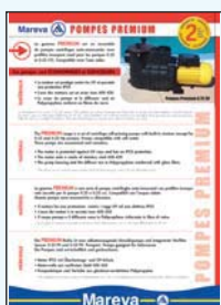
450 049 Pompe Premium