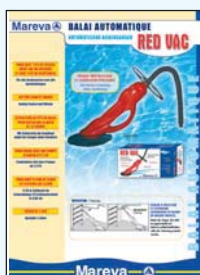
450 131 Red Vac