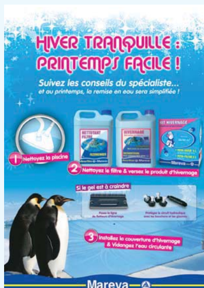
450 268 HIVERNAGE