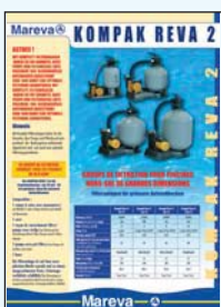
450 117 Kompak Reva 2