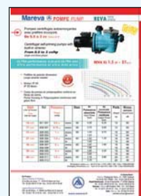
450 046 Pompe Reva Max