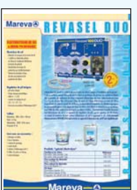
450 129 Revasel Duo