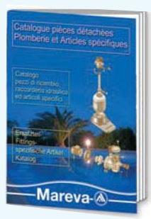
450 822 - Catalogue Pièces Détachées et articles à la commande