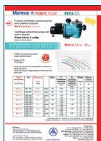
450 046 Pompe Reva Max