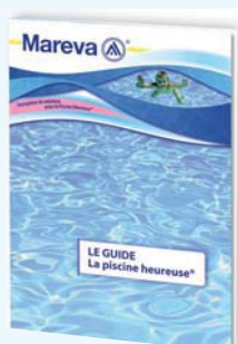
450 222 - Guide de la Piscine Heureuse