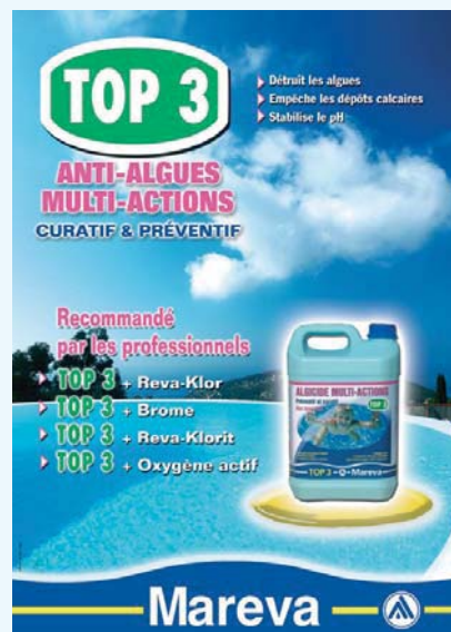
450 300 TOP 3