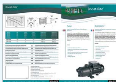
450 120 Surpresseur Boost-Rite