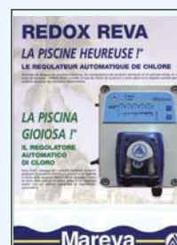
450 410 Regul chlore Redox Reva