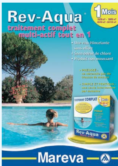
450 265 REV-AQUA