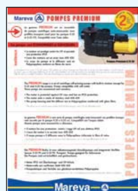
450 049 Pompe Premium