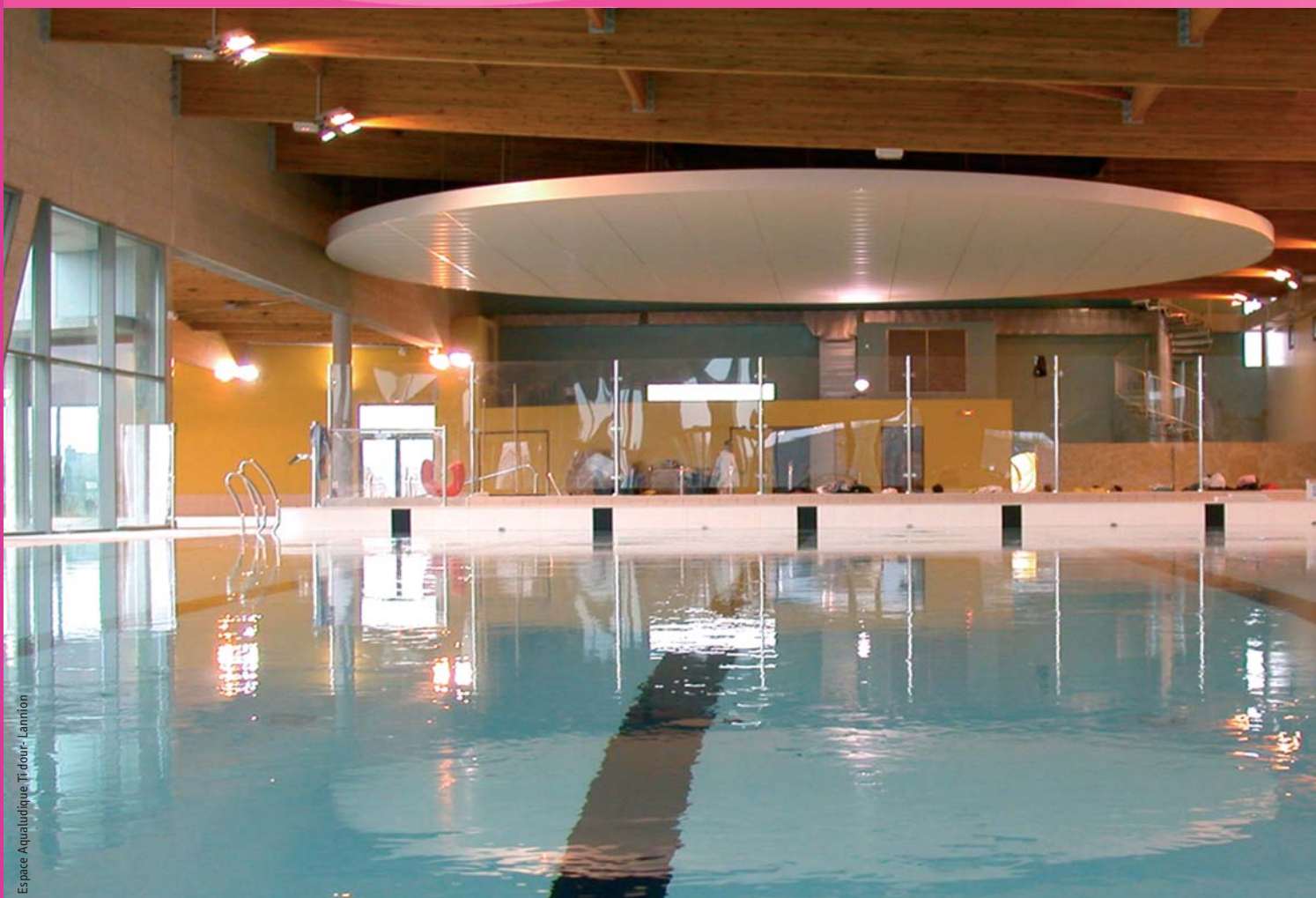
Espace Aquatique Ti'dour - Lamton