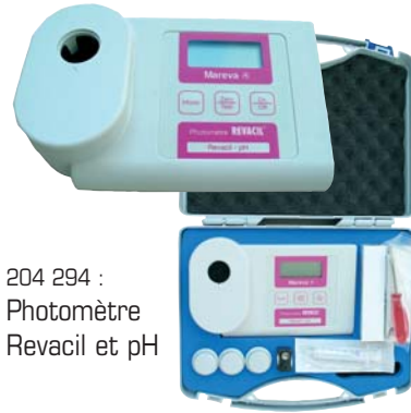
204 294 : Photomètre Revacil et pH