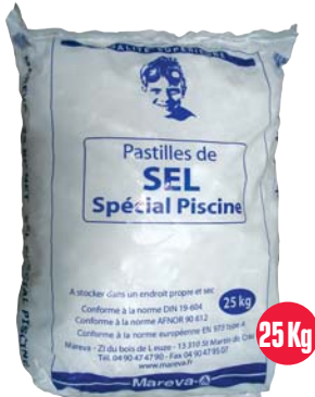
25 Kg 963 040 : Sel 25 kg