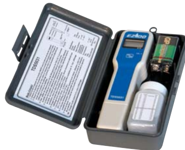
204 016 - STD Test électronique

vendu uniquement par palette prix départ