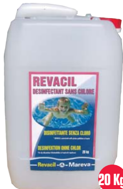
20 Kg 180 162